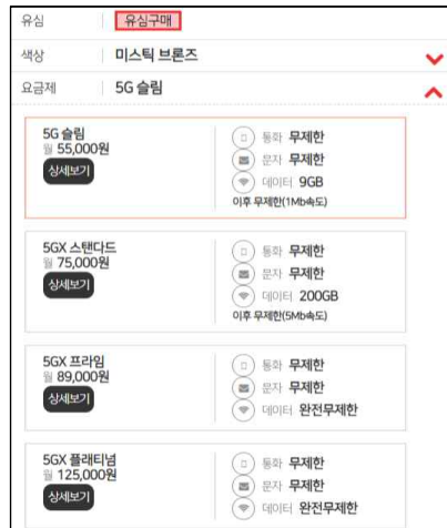
(핸드폰 컨설팅창 요금제 확인)